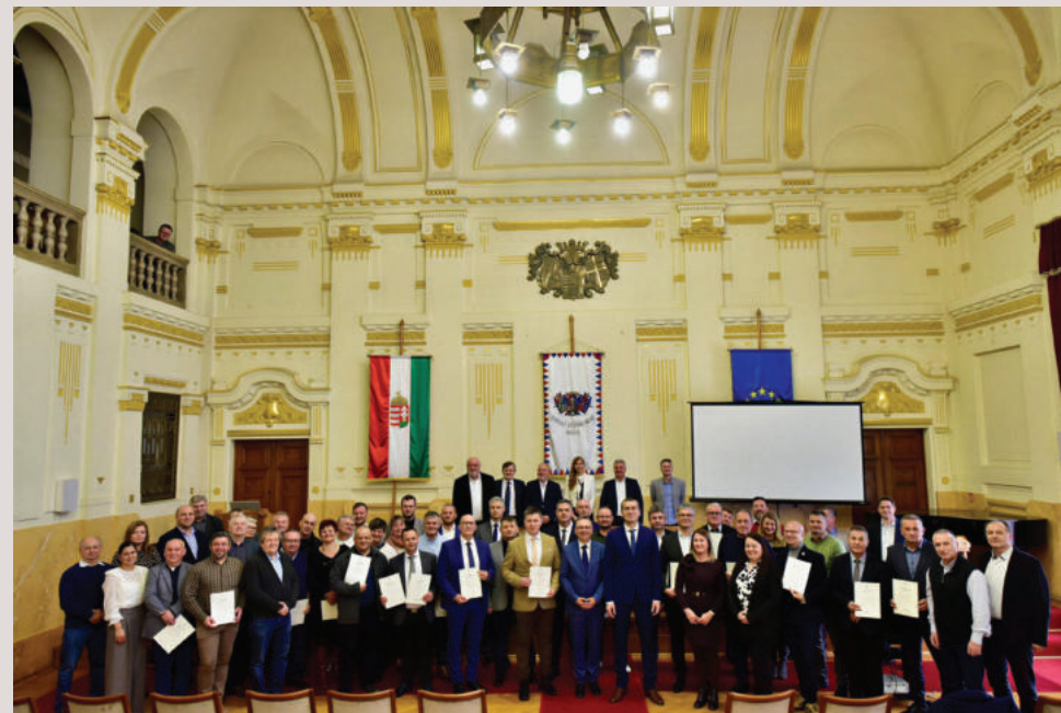
Támogató oklevelek átadása a Vármegyeházán

A Közigazgatási és Területfejlesztési Minisztérium – mint Támogató – koordinálásával jutottak el a céltámogatások többek között építéshez, beruházáshoz, felújításhoz kapcsolódó terület-előkészítés finanszírozására, azokhoz kapcsolódó műszaki tervdokumentáció, építészeti-műszaki tervezési szolgáltatás, ezzel összefüggő hatósági eljárások és kivitelezési munkák költségeinek fedezésére. Mód nyílt és adódik eszközbeszerzésre, a járás, illetve a települések lakosságát érintő közcélú létesítmények, szolgáltatások biztosítására, létesítmények működtetésére és karbantartására, beleértve a humán erőforrás-igények költségeit is. Érdemes megragadni a pályázati célokhoz köthető ingatlanvásárlásban, rendezvényekben rejlő lehetőségeket, de olyan tevékenységekhez is támogatás nyerhető, mint a projekt-előkészítés és projektmenedzsment, a közbeszerzési, műszaki ellenőr szolgáltatás, a tájékoztatás/nyilvánosság költségei.